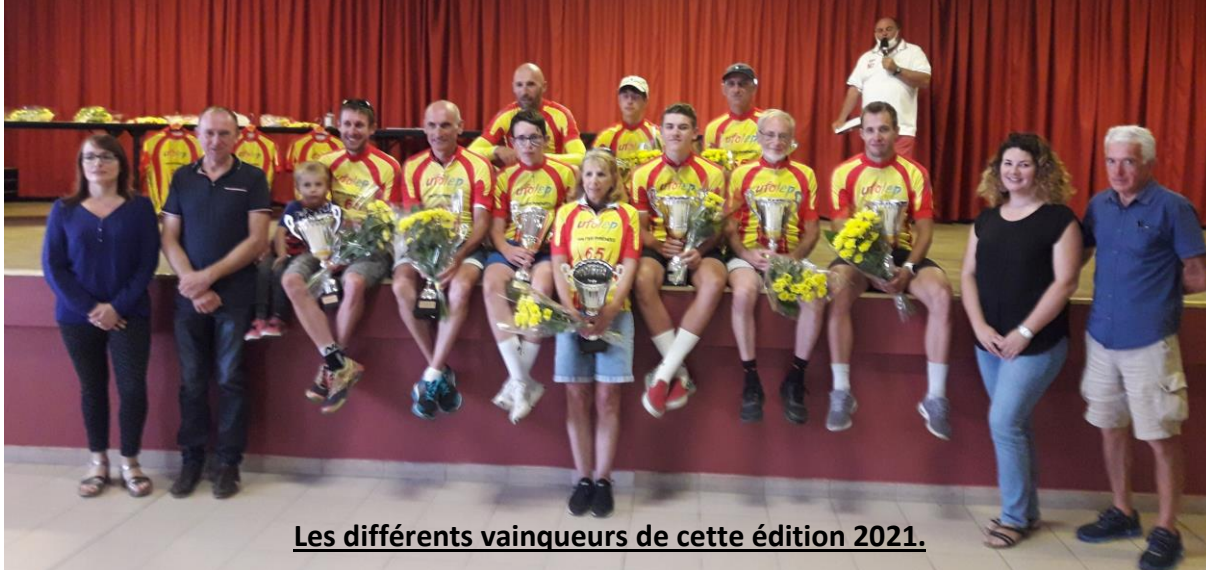
Les différents vainqueurs de cette édition 2021.